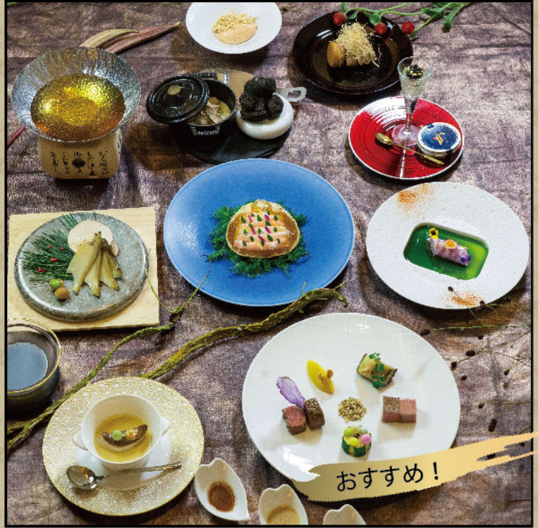
豪華フレンチ会席 2食付きプラン 3万円 選 福井の食材による和フレンチ会席「福寿」 フォアグラ、トリュフ、越前蟹、アワビ、ふぐ、若狹牛等を使った最高級料理