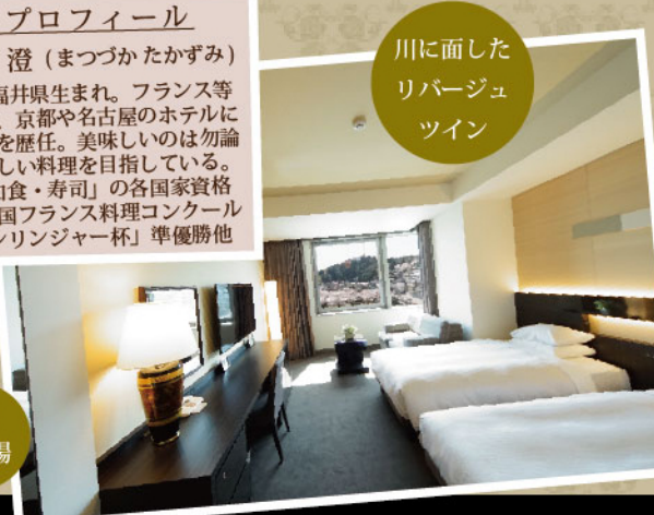
川に面した リバージュ ツイン