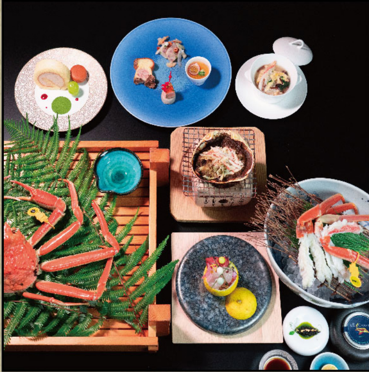
越前蟹 2食付きプラン 5万円 選 越前ずわいがに「冬の海」 ゆで蟹半身 (2人で1杯)、焼き蟹、蟹刺し他